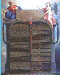
Déclaration des Droits de l'Homme et du Citoyen - 1789