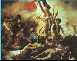
La Liberté guidant le peuple d'Eugène Delacroix - 1830