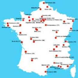
Réseau des Arcadies Décembre 2004

La mise en œuvre de ces principes depuis sept années à Caen ont pu démontrer l'efficacité de cette Charte à répondre à ces objectifs tout en respectant les objectifs premiers de notre association.