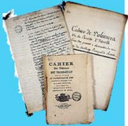
Cahiers de doléances Avril 1789