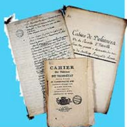
Cahiers de doléances Avril 1789