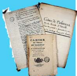
Cahiers de doléances Avril 1789

Des débats avec intervenants sur des thèmes décidés au préalable par le bureau de l'association. Il est possible que ces travaux de notre association suivent l'ordre du jour de l'Assemblée Nationale. Ainsi, les citoyens pourront s'exprimer sur des sujets déjà traités par les autorités politiques et pourront évoquer les mesures qu'ils auraient prises à leur place. Les débats avec intervenants peuvent également porter sur tous les thèmes de société.